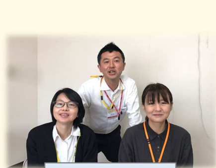
地域医療連携係 (事務)