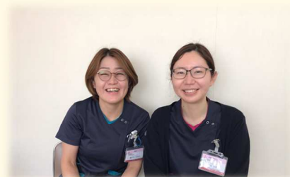
入退院管理室 (看護師)