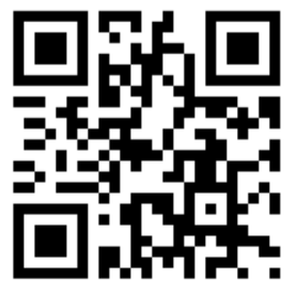
※八尾市社会福祉協議会 ホームページQRコード

案内配架場所・・・社会福社会館、市役所本館1階総合案内、各出張所等 八尾市社会福祉協議会ホームページ（右記QRコード）よりダウンロードできます。